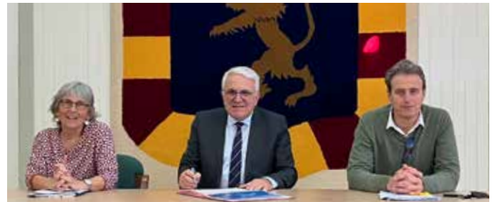
Signature de la charte

Peu de temps avant c'est une commission municipale dédiée et transpartisane qui avait vu le jour et qui se réunit depuis régulièrement pour œuvrer localement et concrètement à toutes les améliorations possibles sur cette thématique.