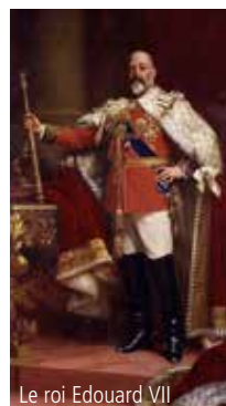
Le roi Edouard VII